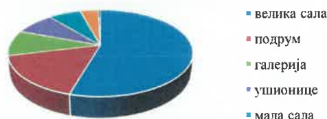
Искоришћеност просторних капацитета у 2022. години

Поред сопствене организационе активности, „Cnesa“ је обезбеђивањем техничких и других услова као и стручном подршком, прихватила и пропратила програме више од 30 других организатора (општинске установе, цивилна удружења, приватна лица).